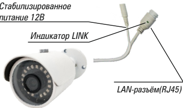
Рис. 1 Схема подключения видеокмеры