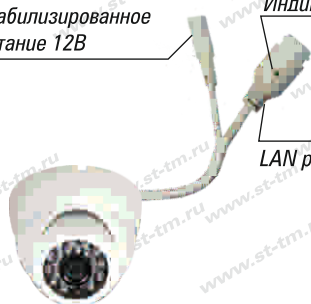
Рис. 1 Схема подключения